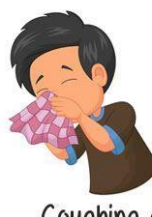
Coughing and Sneezing Hygiene